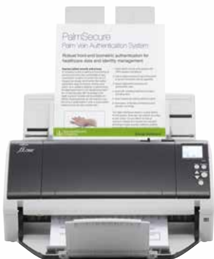
fi-7460 – Portrait A4 à 200/300 ppm 50 ppm / 100 ipm fi-7480 – Portrait A4 à 200/300 ppm 65 ppm / 130 ipm Numérise des lots mixtes, placer jusqu'à 100 feuilles à la fois; ajouter des feuilles lors de la numérisation en continue

Numérisation ultra-rapide avec l'interface USB 3.0, idéal pour la capture d'images grand format, et PaperStream qui permet de créer jusqu'à trois images distinctes de chaque document simultanément, sans retard.