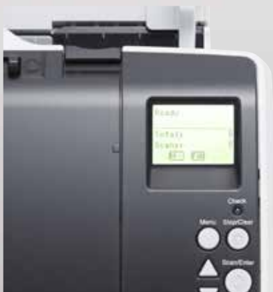
Panneau de contrôle intégré avec écran LCD rétroéclairé

Un écran LCD rétroéclairé sur le panneau de contrôle affiche des informations en temps réel, notamment les paramètres du scanner, l'état de fonctionnement et le compteur de papier. La sélection sur le tableau de bord des routines de numérisation prédéfinies avec la solution puissante PaperStream Capture, incluse dans l'offre, est un jeu d'enfant.